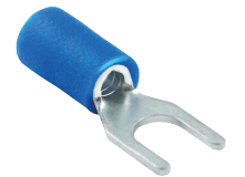
1.5 ~ 2.5 mm 2 Cable Section