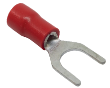
0.5 ~ 1.5 mm 2 Cable Section