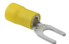
4.0 ~ 6.0 mm 2 Cable Section