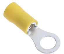
4.0 ~ 6.0 mm 2 Cable Section