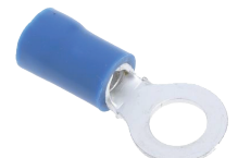
1.5 ~ 2.5 mm 2 Cable Section