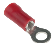
8.0 ~ 10.0 mm 2 Cable Section