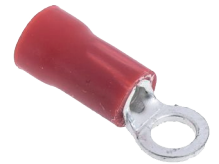
0.5 ~ 1.5 mm 2 Cable Section